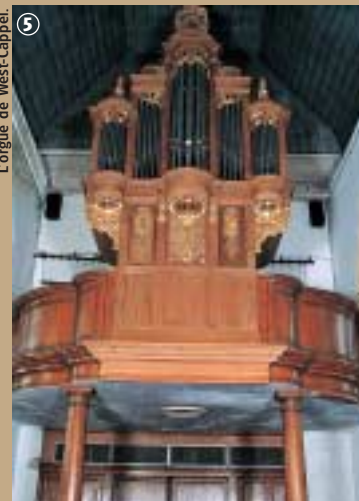
L'orgue de West-Cappel