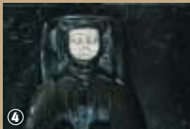
Eglise de West-Cappel.

Chaire à prêcher datant de 1641 et comportant une cuve soutenue par quatre lions de Flandre, sont également remarquables. L'Eglise conserve aussi quelques fragments de 14 vitraux de 1532 parmi les plus beaux des Pays-Bas selon Sanderus. Mais l'orgue datant de 1683, est véritablement le joyau du lieu. Il est signé par Jan Van Belle, facteur d'orgue d'origine berguaise et a conservé plus de 90 % de sa tuyauterie d'origine. Il est considéré à ce titre, comme l'un des plus