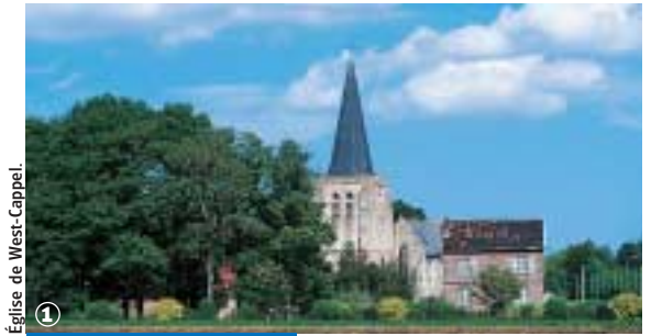
Eglise de West-Cappel.