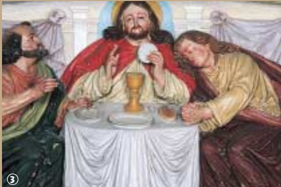
Eglise de West-Cappel.

anciens d'Europe. Il comporte plus de 800 tuyaux, dont la plupart sont en plomb, redécouverts par Philippe Lefebvre, directeur du Conservatoire de Lille et titulaire des orgues de Notre-Dame de Chartres, alors qu'ils étaient rangés dans des caisses, sans doute dans le but d'être réparés au siècle dernier. Restauré par Bernard