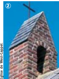
Eglise de West-Cappel.